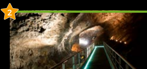
Arditurriko meatzegunea Coto Minero de Arditurri