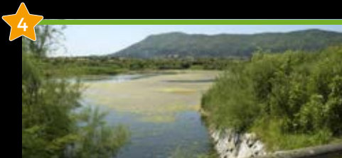
Plaiaundi Parke Ekologikoa Parque Ecológico de Plaiaundi

🍷 Nahitaez probatu behar duzu No debes de probar