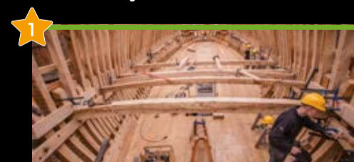
Albaola Itsas Kultur Faktoria Factoría Marítima Albaola